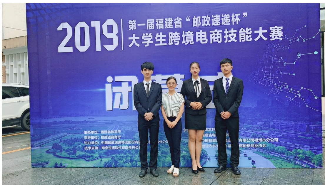
2019年第一届福建省“邮政速递杯”大学生跨境电商技能大赛一等奖