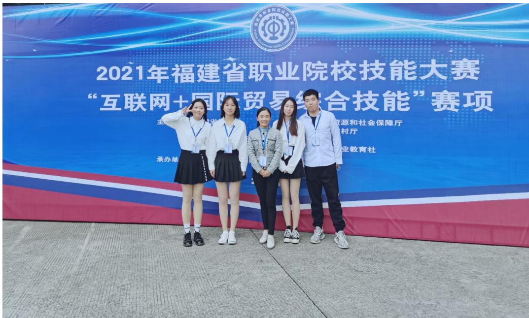
2021年福建省职业院校技能大赛“互联网+国贸综合技能”赛项一等奖