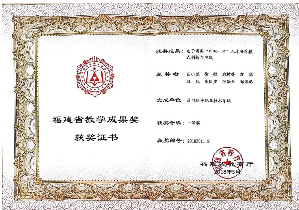
图1：团队教学成果一等奖