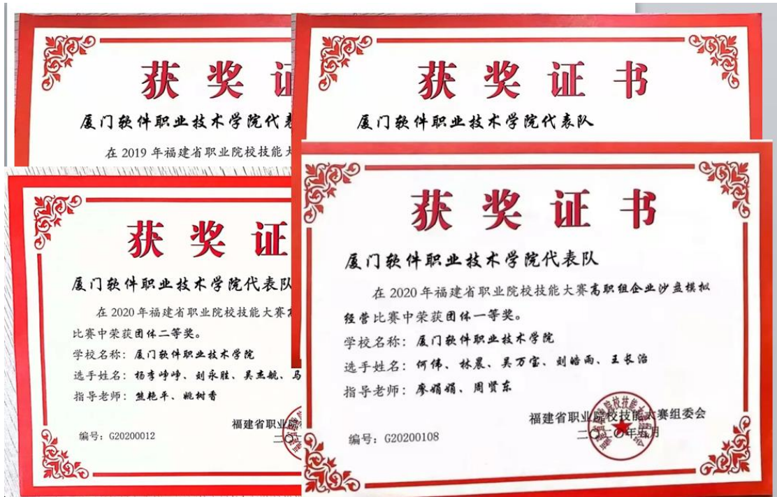
图3：团队教师指导学生技能竞赛成果