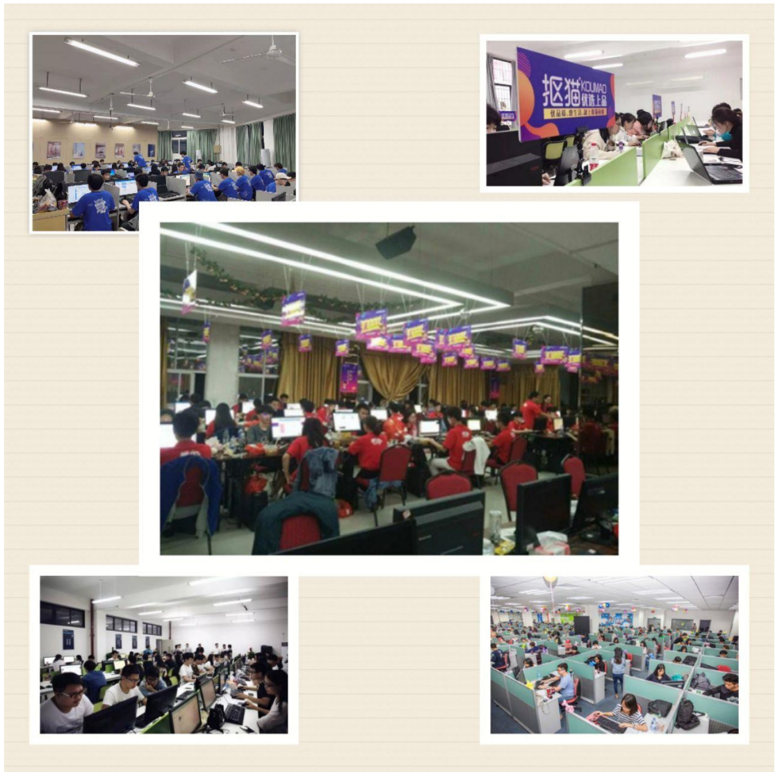
图5：顶岗实践企业真实项目