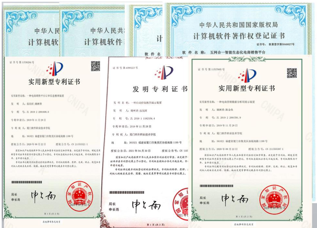
图4：团队教师科研成果