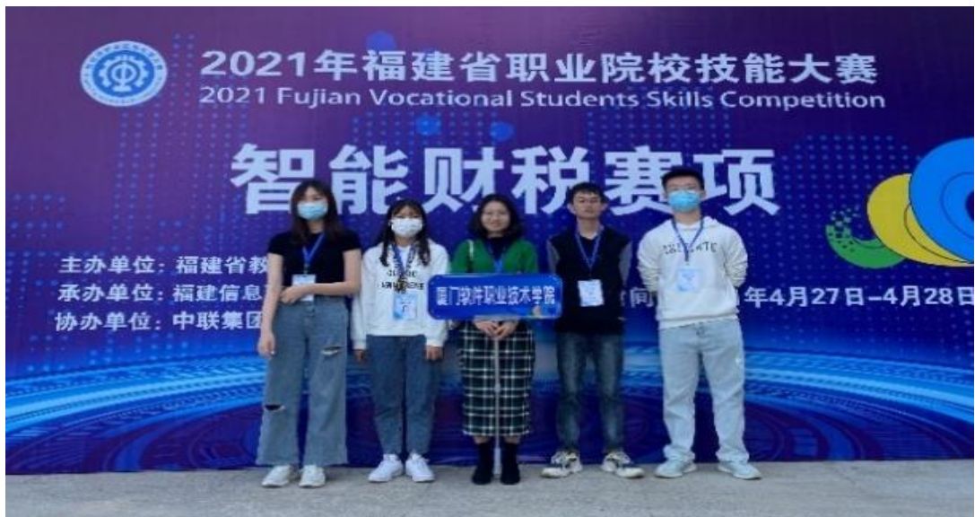
图4 学生参加技能竞赛

本专业学赛融合，注重学生综合职业技能培养，开展各类院级专业技能竞赛，同时鼓励学生积极参加各类省市级技能大赛，荣获：福建省职业技能竞赛会计技能二等奖、智能财税三等奖、智慧金融三等奖、市场营销三等奖；全国职业院校税务技能大赛三等奖、全国高职院校财税技能大赛华南赛区决赛三等奖；厦门市高职技能竞赛会计技能竞赛一等奖等。