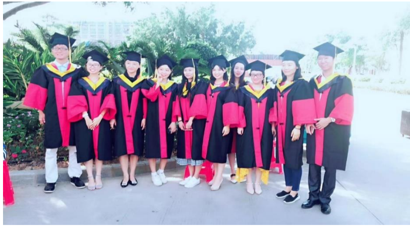
图 1 学院部分教师风采