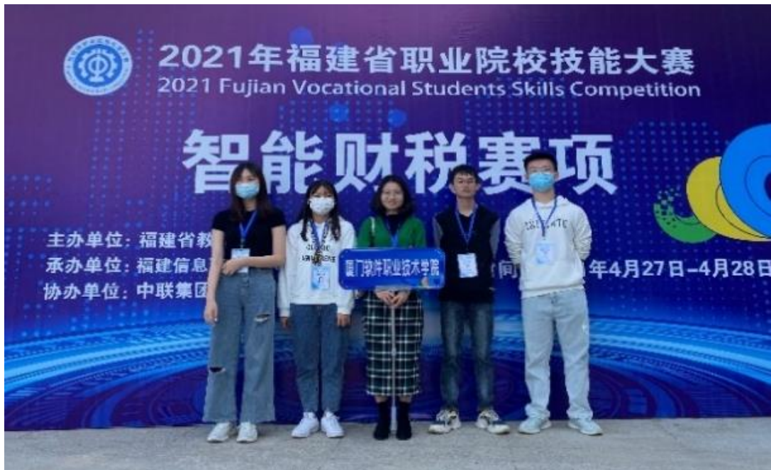
图4 学生参加技能竞赛

本专业学赛融合，注重学生综合职业技能培养，开展各类院级专业技能竞赛，同时鼓励学生积极参加各类省市级技能大赛，荣获：福建省职业技能竞赛会计技能二等奖、智能财税三等奖、智慧金融三等奖、市场营销三等奖；全国职业院校税务技能大赛三等奖、全国高职院校财税技能大赛华南赛区决赛三等奖；厦门市高职技能竞赛会计技能竞赛一等奖等。