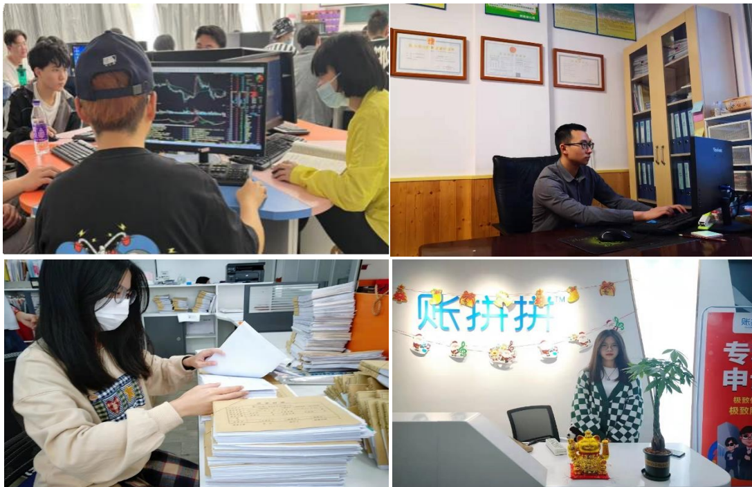
图 2 学生参加实践活动

学院建设“设备先进、校企共建、师资一流”的开放性校内外实训基地。与多家知名企业建立了稳定的实践教学合作，引入企业真实项目，助力学生玩转专业前沿技能。如：名鞋库网络科技有限公司、九牧厨卫股份有限公司、厦门加捷财税事务所集团有限公司、账拼拼（厦门）科技有限公司、厦门贞安财务管理有限公司等。