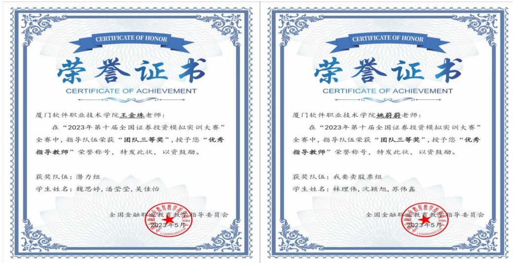
图：专业老师在全国证券投资模拟实训大赛中获“优秀指导教师”称号