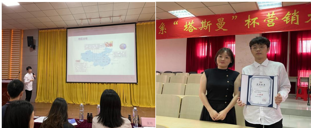
图：2021 级专业学生参加校企合作“塔斯曼”杯营销大赛荣获二等奖