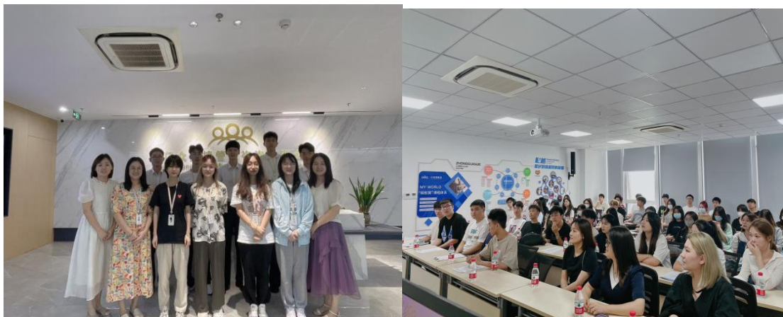
图：专业学生走进企业实训