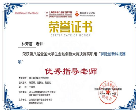
图：专业老师在全国大学生金融创新大赛决赛中获“优秀指导教师”称号