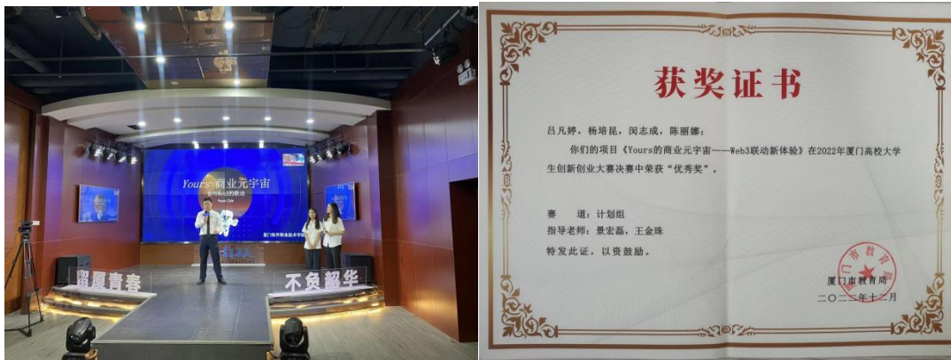
图：2020 级专业学生参加 2022 年厦门高校大学生创新创业大赛获优秀奖