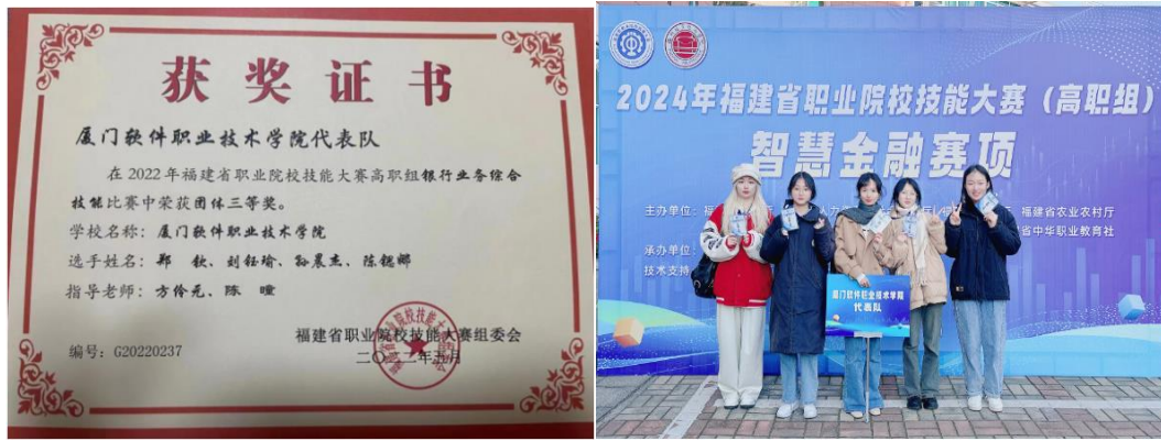
图：2022 及 2024 年度得学生参加省级技能大赛银行综合技能赛项及智慧金融赛项获三等奖