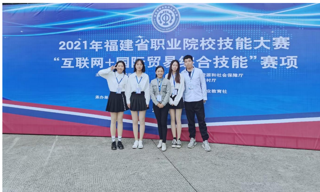
2021年福建省职业院校技能大赛“互联网+国贸综合技能”赛项一等奖