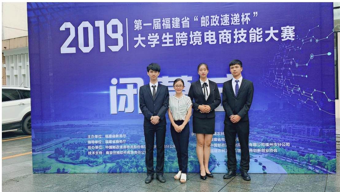
2019年第一届福建省“邮政速递杯”大学生跨境电商技能大赛一等奖