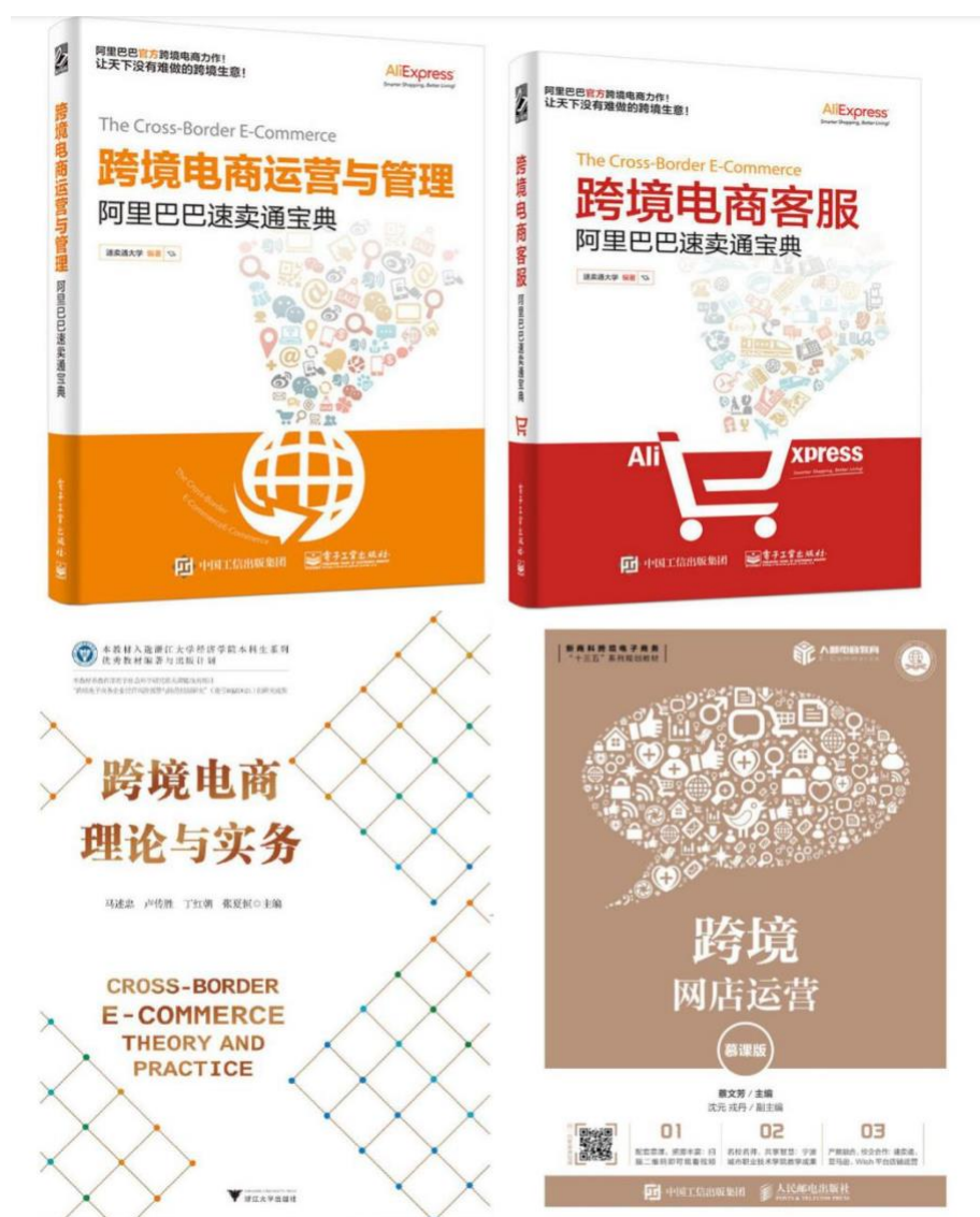
跨境电子商务教学团队编写的教材

教学团队通过“产教融合、校企合作”培养应用型跨境电商人才，加强大学生实践能力、创新精神和社会责任感的培养。专业大力发展校企合作，旨在提高我院学生动手实践能力、创新创业能力，推进产