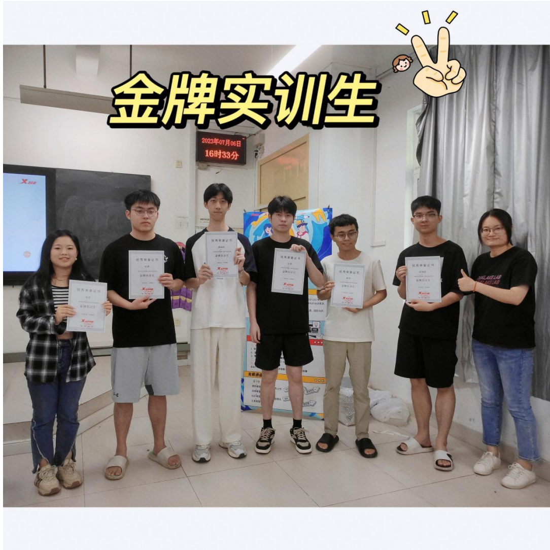
荣获特步电商“金牌实训生”的同学合影