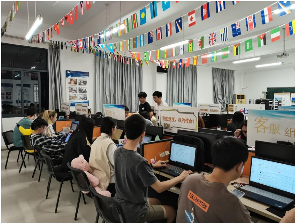
2020年全国新零售技能大赛高职组一等奖&二等奖