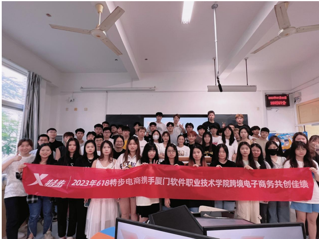
2023 年特步 618 大促实训项目师生合影

学研融合发展，实现人才共育，进而提高各专业人才培养质量，为厦门地方经济培养和储备电商人才贡献自己的力量。 以下是专业近来与知名运动品牌特步校企合作成果。