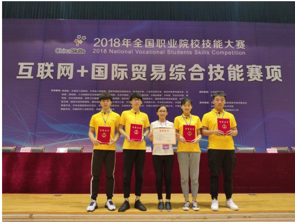
2018 年全国职业院校技能大赛“互联网+国际贸易综合技能”赛项荣获三等奖