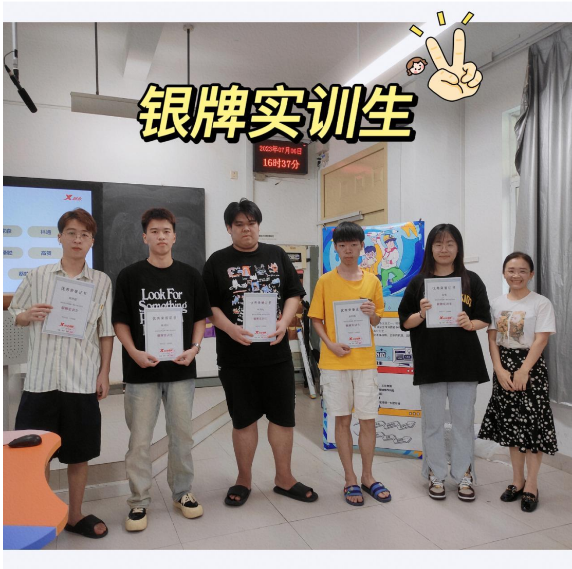
荣获特步电商“银牌实训生”的同学合影