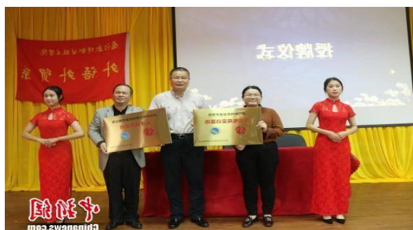
跨境电商创新创业协会成立

跨境电子商务教学团队共获多项教学成果大奖，包括2020年福建省职业教育教学成果奖二等奖等。在跨境电子商务教学团队的努力下，本专业的学生在全国全省等各类职业技能比赛中获得骄人的成绩。教学团队指导学生获得22项国家及省级技能大赛重要奖励，包括以下：