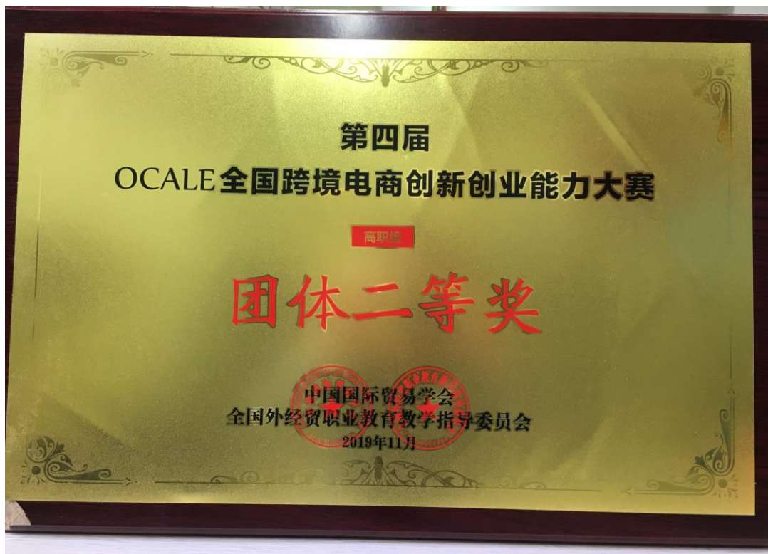
2019年第四届 OCALE 跨境电商创新创业能力大赛技能赛二等奖