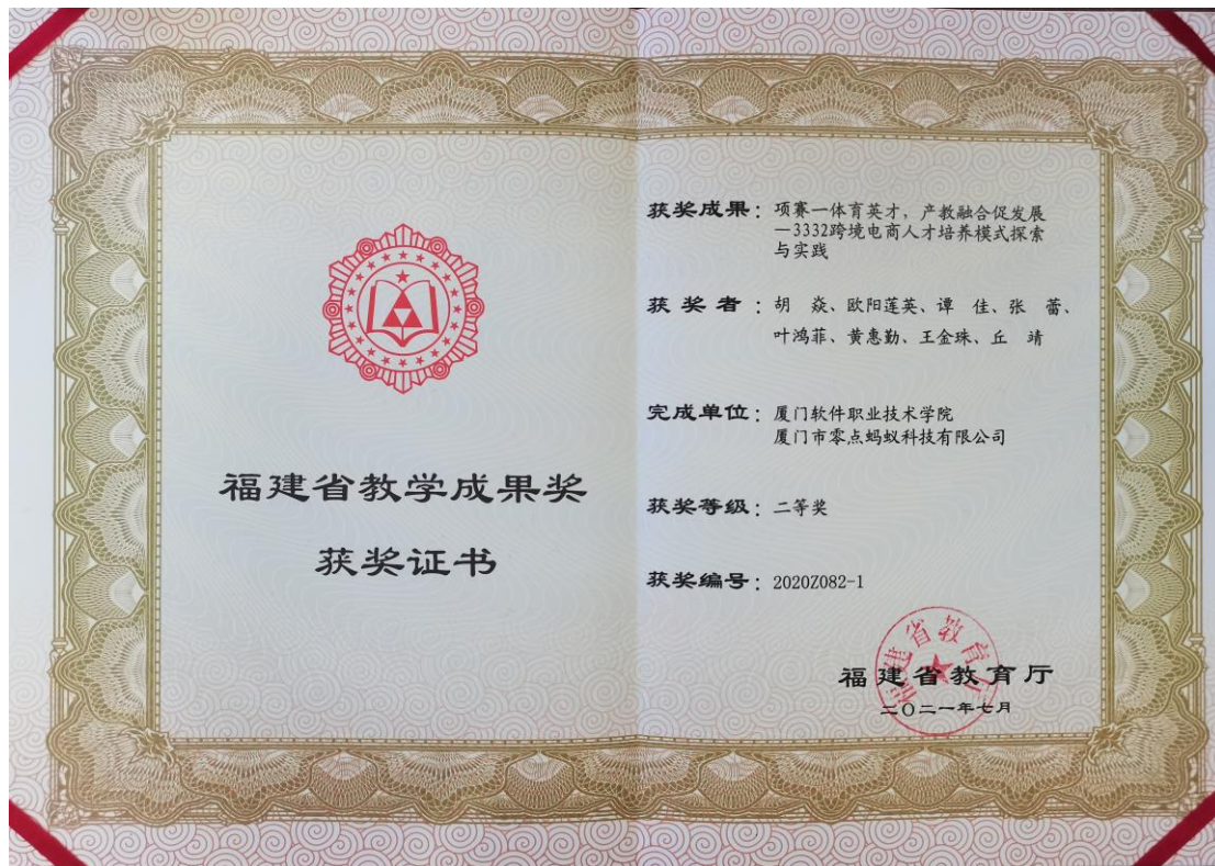
2020 年福建省职业教育教学成果奖二等奖