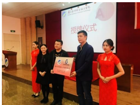
现代学徒制开班仪式

星青年计划”项目，并携手厦门港务物流有限公司、深圳服务贸易企业促进会等知名企业，共建“一带一路”跨境电商产学研合作基地。