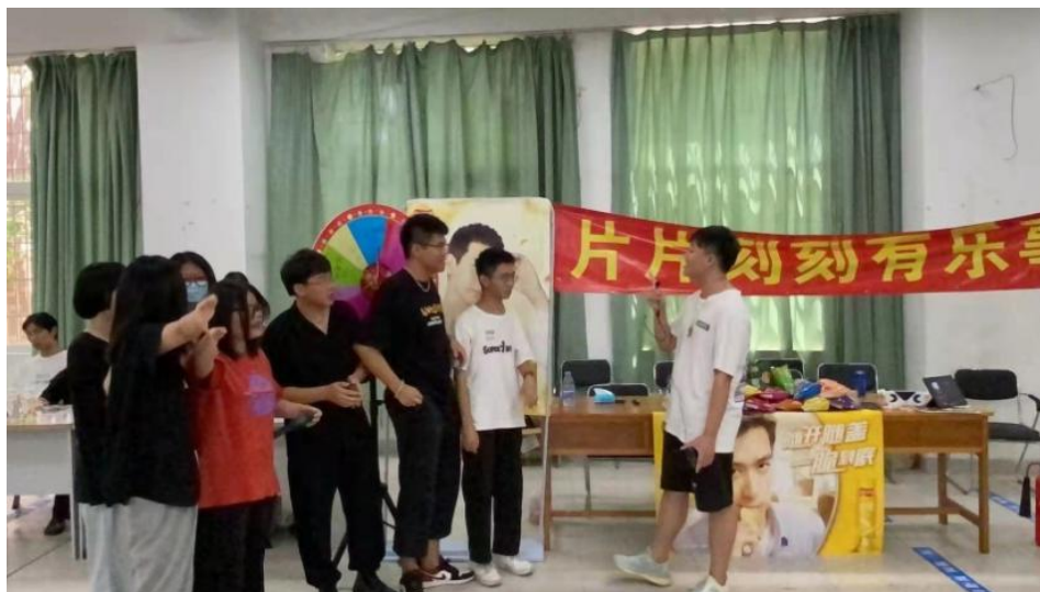
跨境电商商品展销大赛

此外，在专项实训活动中，跨境电子商务专业积极开展各类实践项目以提升学生的实践操作技能。例如：跨境电商商品展销大赛，互联网+国际贸易综合技能大赛等等。