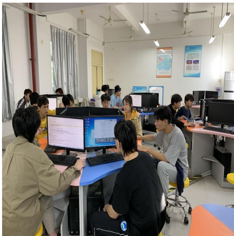
互联网+国际贸易综合技能大赛