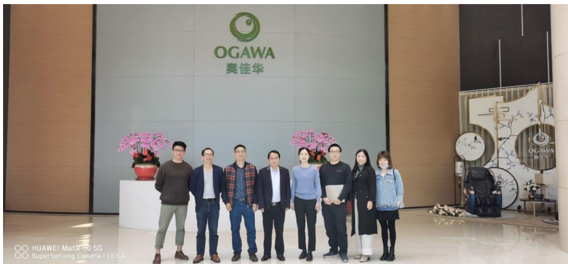
图 2 教学团队走访企业看望实习学生