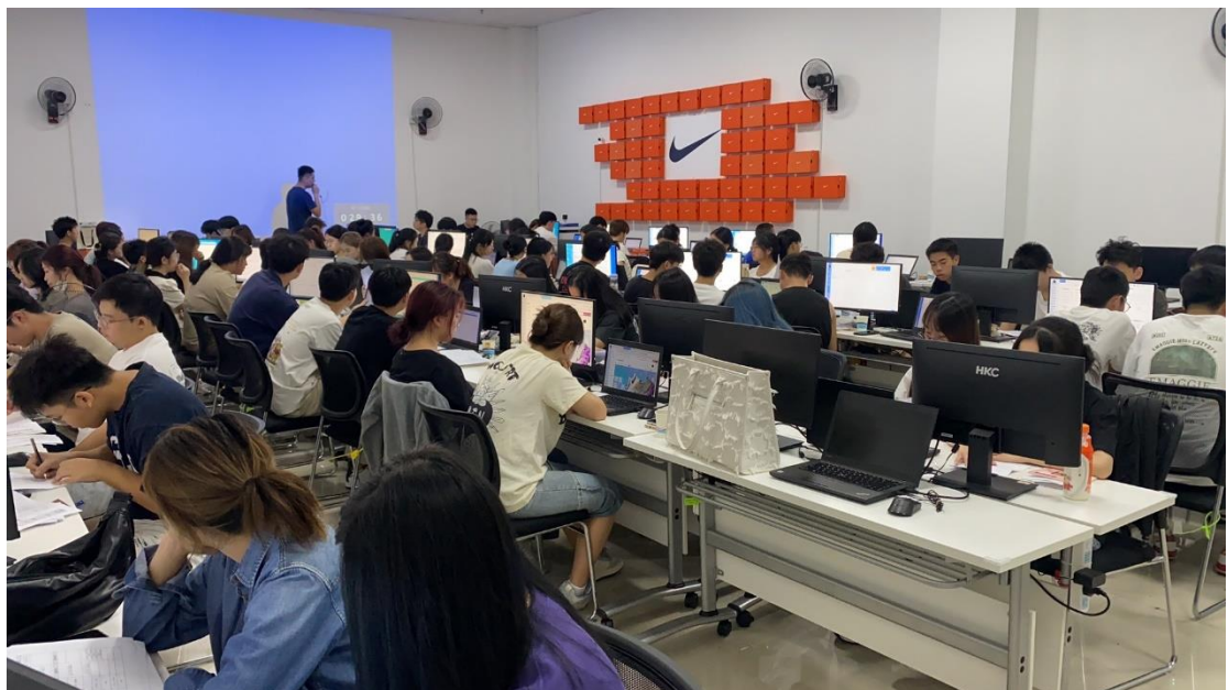
图 4 耐克 Nike 校企合作实训