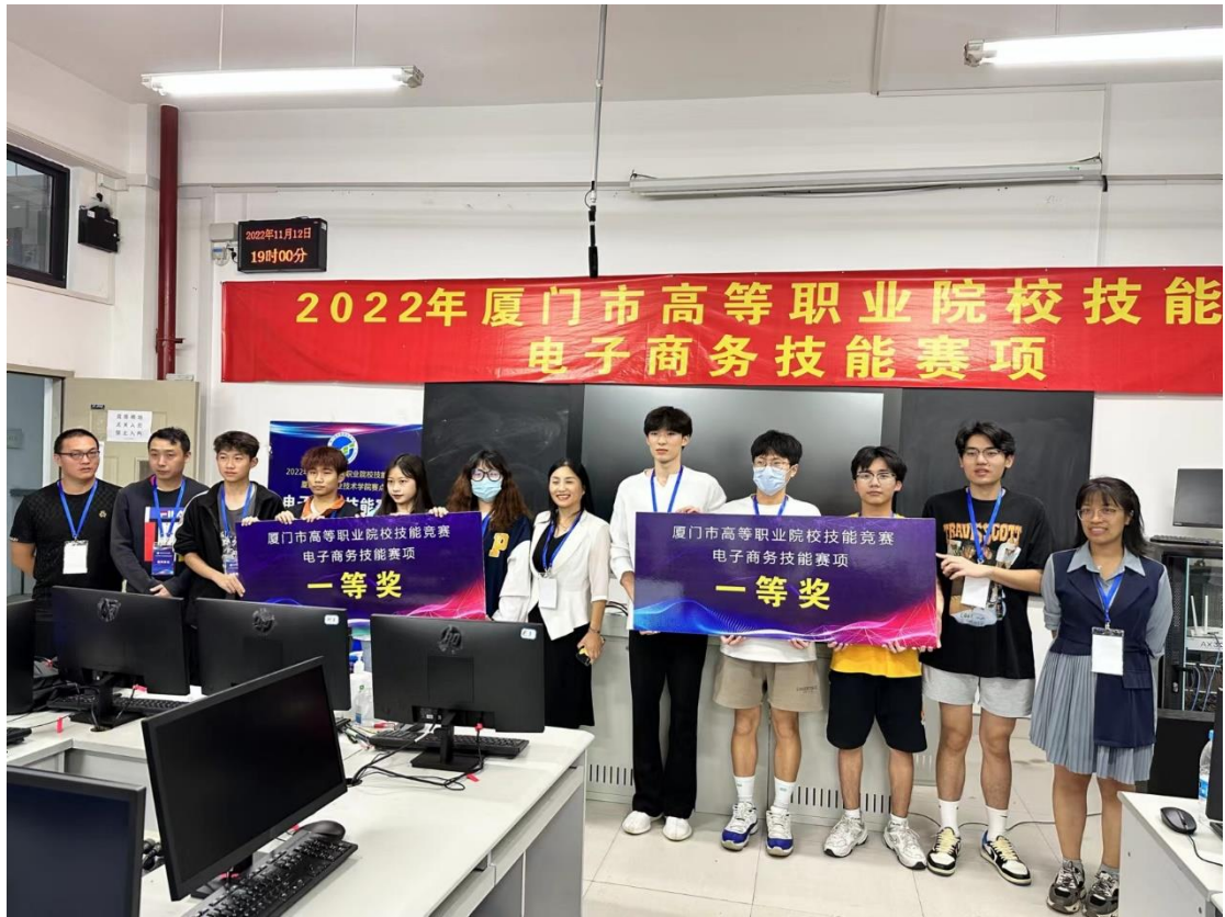
图 1 教师指导学生参加技能竞赛