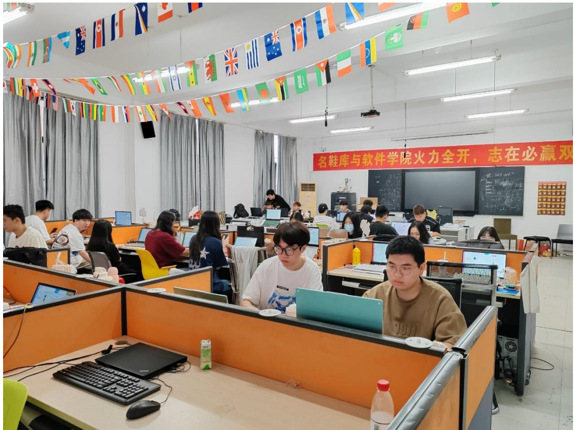
图 3 名鞋库电商校企合作实训