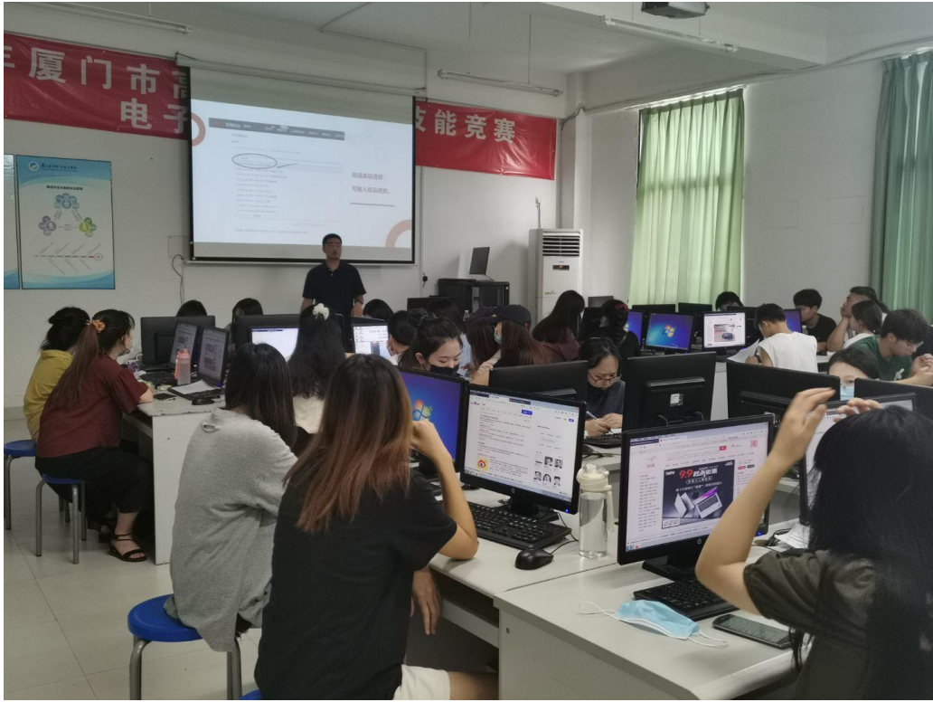
图 5 企业电商项目引进课堂